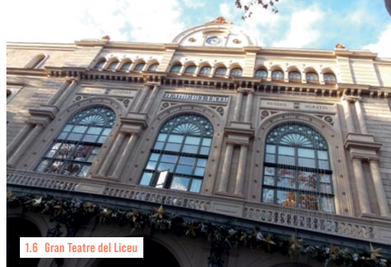
1.6 Gran Teatre del Liceu