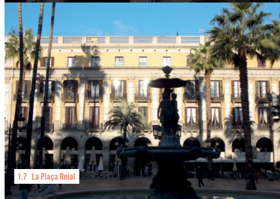
1.7 La Plaça Reial