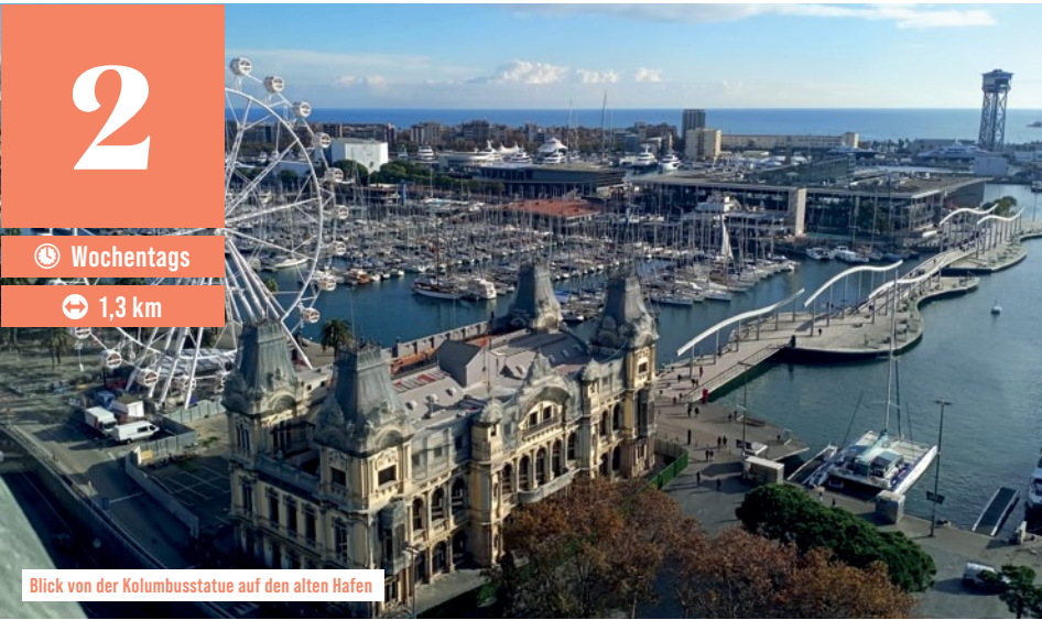
Blick von der Kolumbusstatue auf den alten Hafen