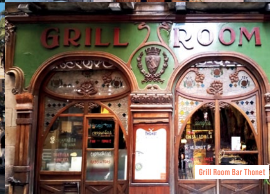
Grill Room Bar Thonet

nach Einbruch der Dunkelheit ein, um sich in der ehemaligen Hippy-Diskotheek Karma, dem Rockschuppen Sidicar oder dem Jazzclub Jamboree auszutoben.