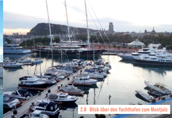
2.8 Blick über den Yachthafen zum Montjuïc