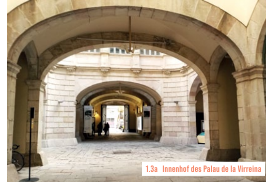
1.3a Innenhof des Palau de la Virreina