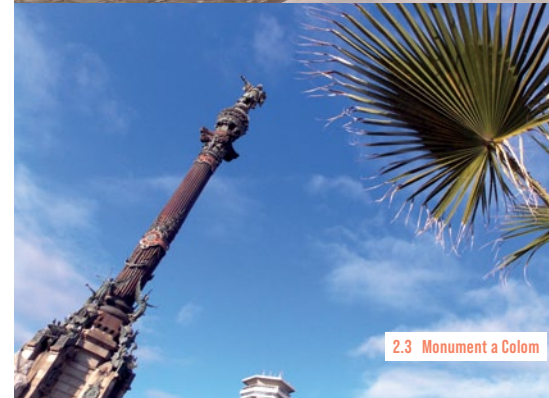
2.3 Monument a Colom

der hölzernen Ictíneo I [2b] bewundern. Der Prototyp eines der ersten U-Boote wurde 1859 im nahen Hafenbecken getestet. Den Eingang zum Museum findet man an der Hafenseite. ☺ Di-So 10-20 Uhr ☺ Erw. 10 €, Stud. (bis 24 J.) 5 €, Jugendl. (bis 17 J.) frei, So ab 15 Uhr Eintritt frei ☺ Avinguda de les Drassanes, s/n 🌐 mmb.cat