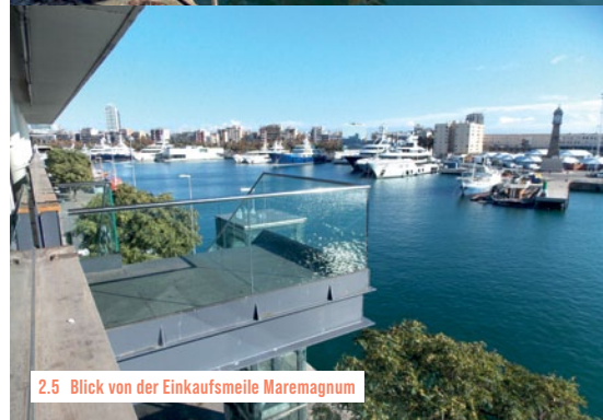
2.5 Blick von der Einkaufsmeile Maremagnum

Nach Erkenntnissen von Barcelonas Tourismusverband ist Shopping der wichtigste Grund für Reisen in die Stadt, noch vor Strand und Kultur. Warum der lange Reiseweg auf sich genommen wird, um dann bei den weltbekannten Ladenketten einzukaufen, bleibt dem Kulturskeptiker ein Rätsel. Im Maremagnum, einer Mall im amerikanischen Stil, wird dieser Teil der Besucherschaft bestens bedient. 🕒 Täglich 10-21 Uhr, Öffnungszeiten der einzelnen Läden individuell verschieden 🆓 Frei 📍 Moll d'Espanya 5 🌐 maremagnum.klepierre.es