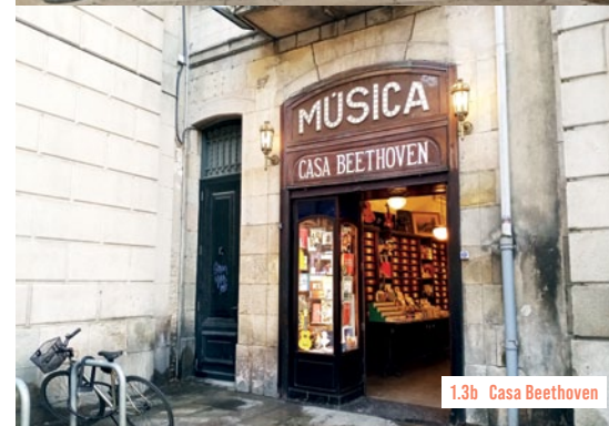
1.3b Casa Beethoven