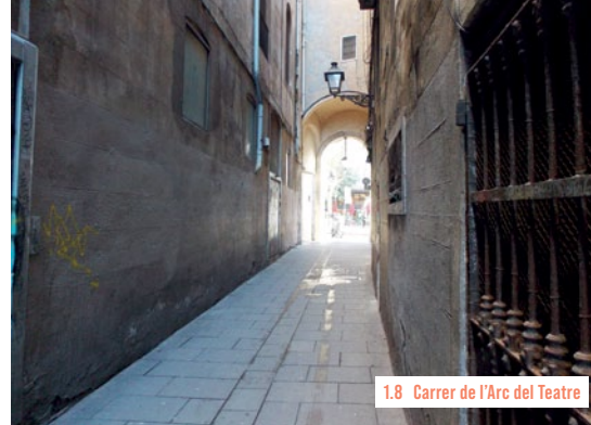
1.8 Carrer de l'Arc del Teatre