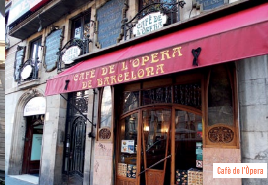
Café de l'òpera