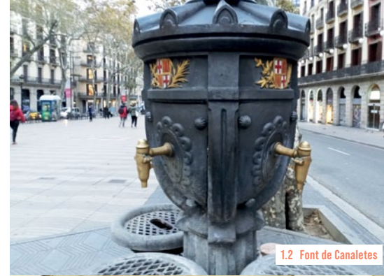
1.2 Font de Canaletes

An dem an sich unscheinbaren Brunnen [2a] feiern Fans des FC Barcelona zu Tausenden wichtige Siege. Die Tradition reicht in die 1930er-Jahre zurück. Mangels Radio- und Fernsehübertragungen warteten die Anhänger ungeduldig auf den Aushang der Ergebnisse im Schaukasten der Zeitungsredaktion im Gebäude hinter dem Brunnen. Wenige Schritte weiter, auf dem Dach des Teatre Polirama [2b] , war während des von 1936 bis 1939 dauernden Spanischen Bürgerkriegs der Freiwillige George Orwell postiert, um den Sitz der »Arbeiterpartei der marxistischen Vereinigung« (span. »Partido Obrero de Unificación Marxista«, POUM) im gegenüberliegenden Hotel Rivoli gegen eventuelle Angriffe zu verteidigen.