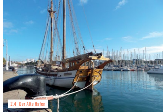
2.4 Der Alte Hafen

Entlang der im 19. Jahrhundert erbauten Mole finden regelmäßig kostenlose Veranstaltungen statt. An Wochenenden und Feiertagen bieten lokale Künstler am Passeig d'Ítaca [7a] zwischen Einkaufsmeile und Kino ihre Werke zum Verkauf an. Dazu gesellen sich an jedem ersten Wochenende im Monat Designer für Mode und Accessoires, oft begleitet von DJs oder Live-Musik. An sommerlichen Samstagabenden wird zum Freiluftkino geladen. Der weiße Klotz ein paar Schritt