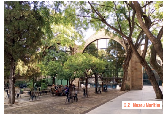
2.2 Museu Marítim