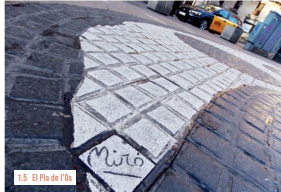
1.5 El Pla de l'Os

Einer der schönsten Plätze der Stadt verbirgt sich schräg gegenüber hinter einem schmalen Durchgang. Hinter den prächtigen Fassaden residierten einst Literaturnobelpreisträger Gabriel García Márquez und der katalanische Liedermacherstar Lluís Llach. Der junge Antoni Gaudí entwarf die klassischen Laternen. Die Restaurants und Cafés unter den Schatten spendenden Arkaden werden tagsüber fast ausschließlich von Touristen frequentiert. Einheimische finden sich erst