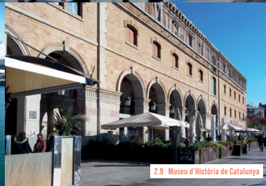
2.9 Museu d'Història de Catalunya